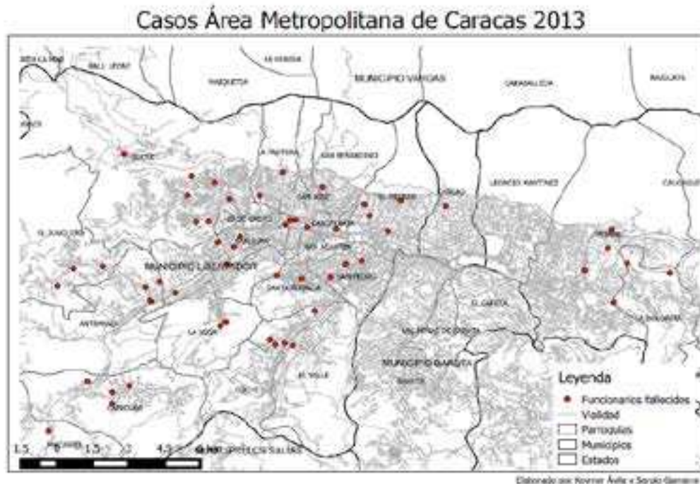
Mapa1. Casos del AMC (2013)