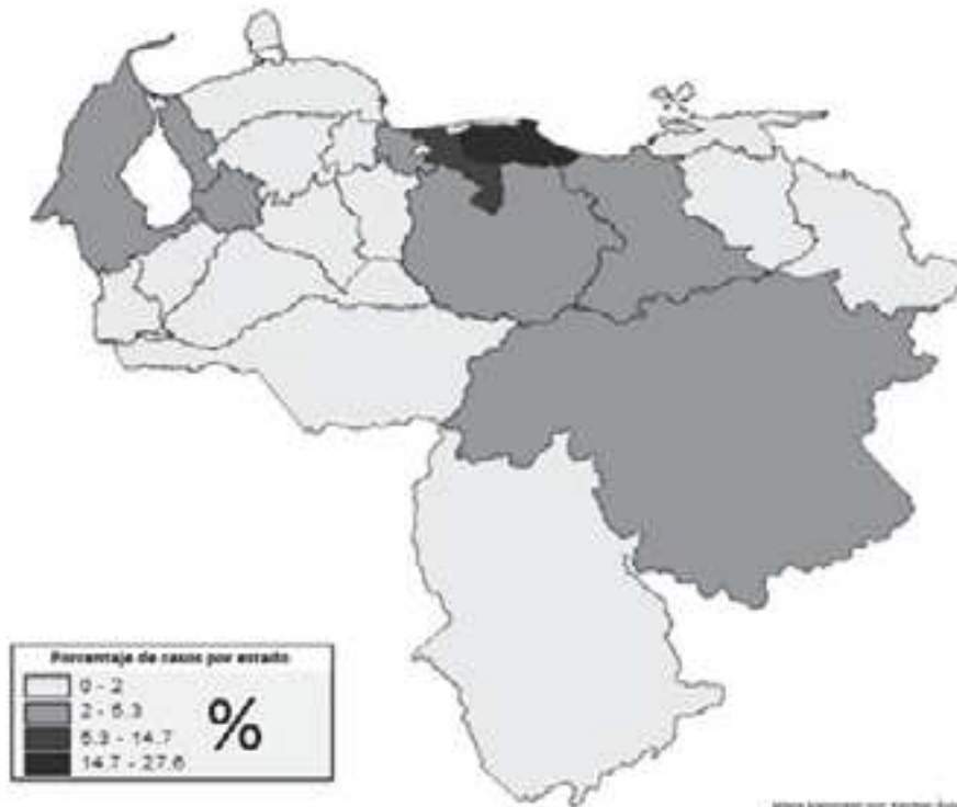
Porcentajes de policías víctimas de homicidio en Venezuela